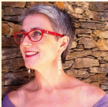
Marie-Louise Duthoit