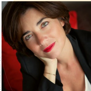
Aurore Couteau-Cénédèse - © DR

AUDITORIUM - SITE CNRR DE LA SEYNE-SUR-MER ENTRÉE LIBRE - RÉSERVATION OBLIGATOIRE