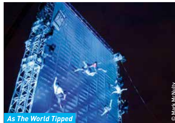
As The World Tipped