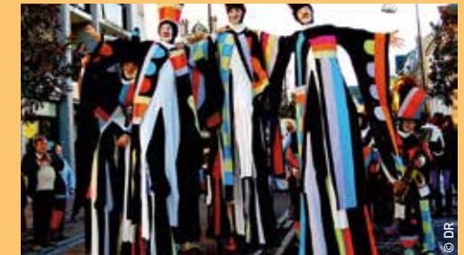
Déambulation Samedi 10 à 12h30 et 17h30 - Plages du Mourillon Dimanche 11 à : 12h - Port / 17h - Centre-ville

> LES EXCENTRIQUES Compagnie Remue Ménage (France)