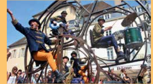
Concert ambulant Vendredi 9 à 13h et 18h, samedi 10 à 11h30 et 16h Plages du Mourillon Dimanche 11 à : 11h - Port / 16h - Centre-ville

Un concert ambulant monté sur une roue géante de quatre mètres, trois musiciens de jazz rock déambulent dans la ville à l'intérieur de cet engin... La musique met en mouvement la mécanique, la mécanique met en mouvement la musique. Un conte urbain itinérant créé par César Alvarez, avec la complicité de la musique originale de Pilu Spagnuolo. « Rodafonio » n'est pas seulement un élément théâtral magnifique mais le mariage parfait entre arts de la rue, théâtre et musique.