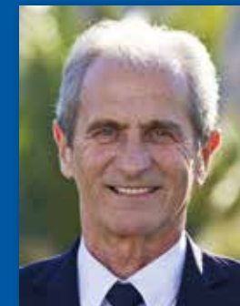
Hubert Falco Président de Toulon Provence Méditerranée

Je vous laisse découvrir le programme des animations ; il y en a pour tous les goûts.