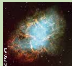
La nébuleuse du crabe à 6000 années-lumière