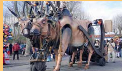
Déambulation Vendredi 9 à 11h, samedi 10 à 15h, dimanche 11 à 16h Centre-ville

> LES VACHES SACRÉES Compagnie Paris Bénarès (France)