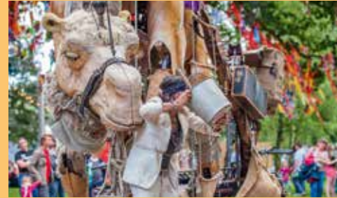
Déambulation Vendredi 9 à 16h30, samedi 10 à 10h30 et 19h, dimanche 11 à 11h30 et 20h - Plages du Mourillon

> CHAMÔH ! Compagnie Paris Bénarès (France)