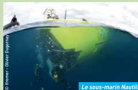
Le sous-marin Nautilus

Soirée autour du film documentaire « Abysses, les Alliances des Profondeurs » [2014] - Prix « Dimitri Rebikoff de l'Innovation » au Festival Mondial de l'Image Sous-Marine (Marseille, 2014). Le documentaire « Pêcheurs de neutrinos » sera présenté en avant-première.