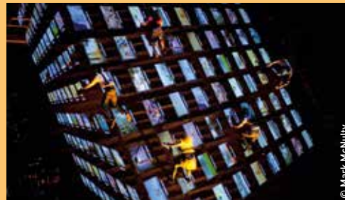
Haute voltige Samedi 10 et dimanche 11 à 21h - Plages du Mourillon

> AS THE WORLD TIPPED Wired Aerial Theatre (Pays de Galles)