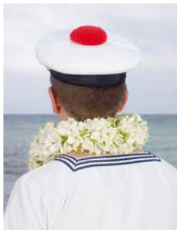
Charles Fréger, Marin avec collier de fleurs de tiaré, Toulon, mars 2013

Exposition photographique issue de la résidence de l'artiste à la villa Noailles.