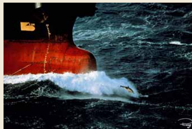
© Philip Plisson, peintre de la Marine