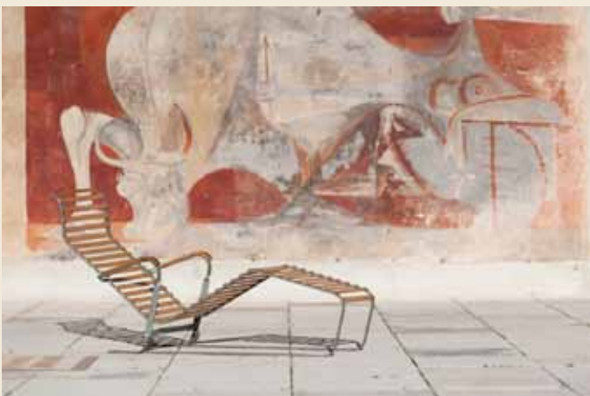
Chaise longue en acier zingué et bois, fabriquée par Embru et distribuée par Wohnbedarf, 1932, Galerie Mandallan-Pailard.