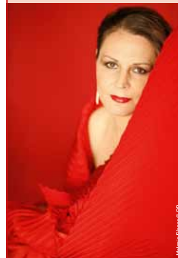
Melanie Diener