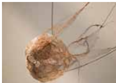
Sans titre (détail), 2015 50x38x31 cm, fil métallique