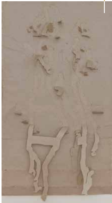
Avec...les 3 Grâces (Botticelli) - Papier - 123x65 cm - 2015