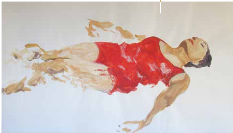
Piscine - Gouache / Papier 90x150 cm 2012