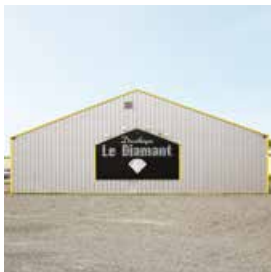
Francois Prost : Le Diamant - 53150 Neuau (Mayenne)

Exposition d'architecture Commande passée pour la création d'une boîte de nuit au sein de la villa Noailles.