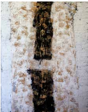
Jean-Paul Pancrazi - Trémaïl du mendiant - F : 162x130 cm

Du 17 septembre au 20 novembre Vernissage le vendredi 16 juin à 18h