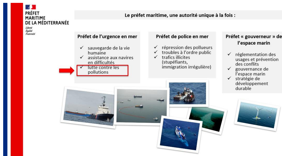
Les trois principaux champs de responsabilité du préfet maritime

Ses missions peuvent être regroupées en trois thématiques principales : « préfet de police en mer », « préfet de l'urgence en mer » et « gouverneur de l'espace marin ». Par son caractère généralement imprévisible et potentiellement destructeur pour l'environnement, le domaine de la lutte contre les pollutions en mer relève du champ de « l'urgence en mer ».