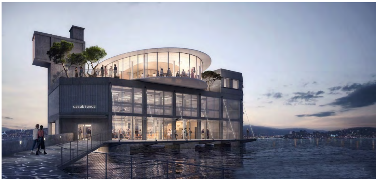
© Major Architecture – HYL – Studio Alma