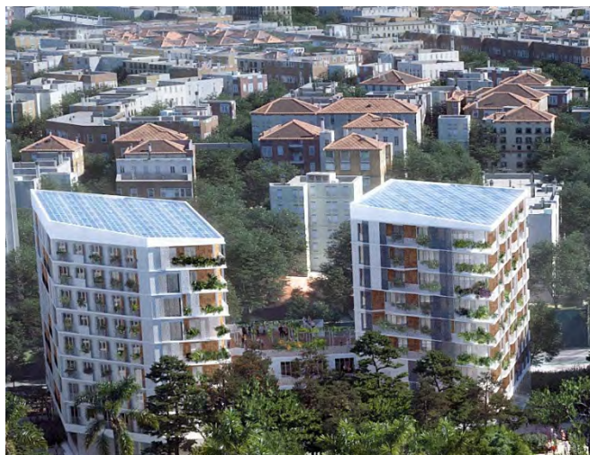
Les 4 bâtiments écologiquement exemplaires, dédiés aux espaces de travail, seront équipés de panneaux solaires.

Un quartier refuge de biodiversité avec un partenariat Nature 2050 : compensation carbone et restauration de la biodiversité