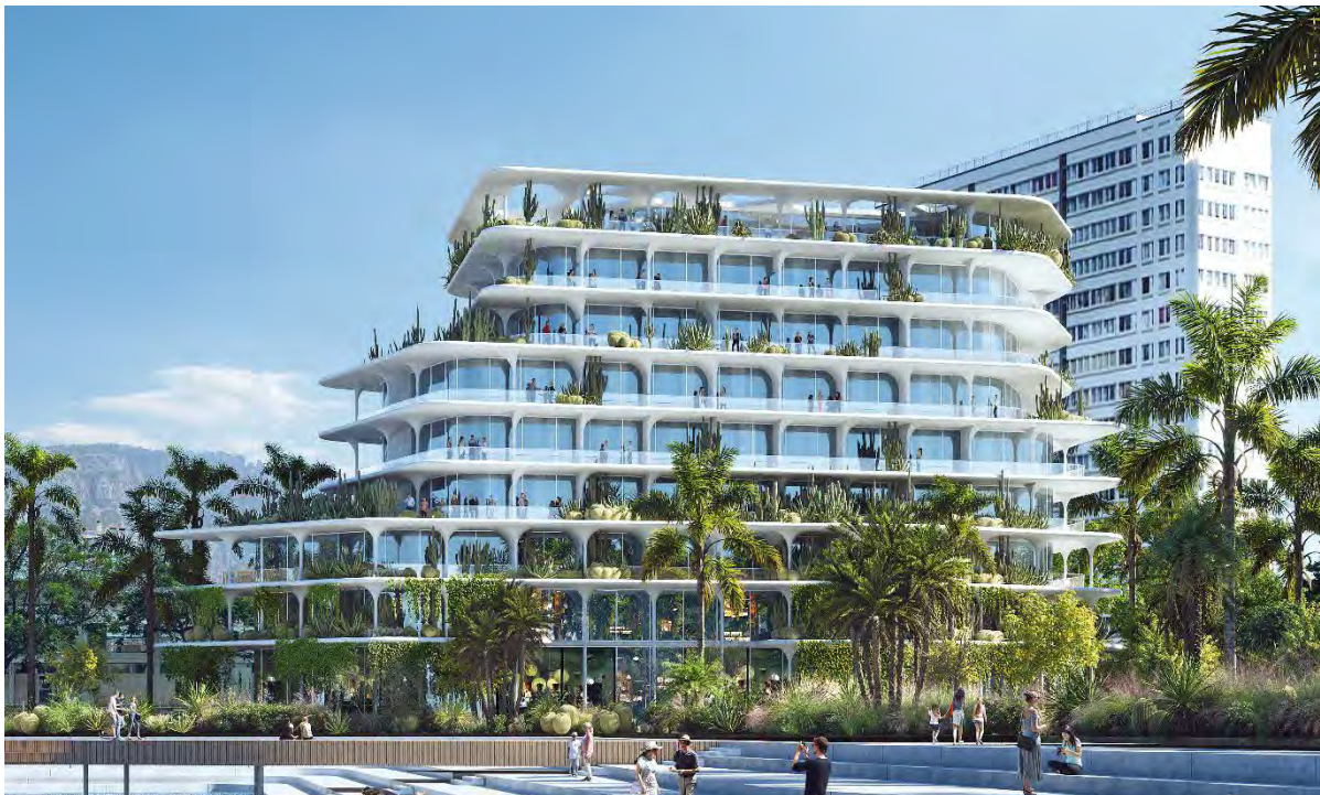
© Snøhetta - Corinne Vezzoni & Associés - HYL - Aesthetica Studio

4- Un hôtel de prestige avec toit-terrasse (roof top) signera l'architecture de ce quartier. Le rez-de-chaussée accueillera un spa et des locaux sportifs. Son dernier étage sera aménagé en un toit-terrasse gastronomique. Cet hôtel de prestige sera équipé de 105 chambres dont 75 avec vue sur la mer.