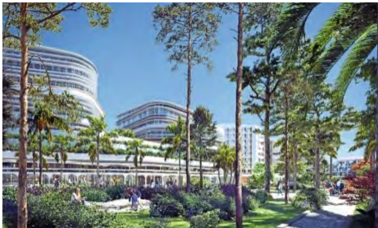
© Snøhetta - Corinne Vezzoni & Associés - HYL - Aesthetica Studio

Nouvel espace public majeur, ce poumon vert de 20 000 m 2 incarnera une présence renforcée de la nature en ville .