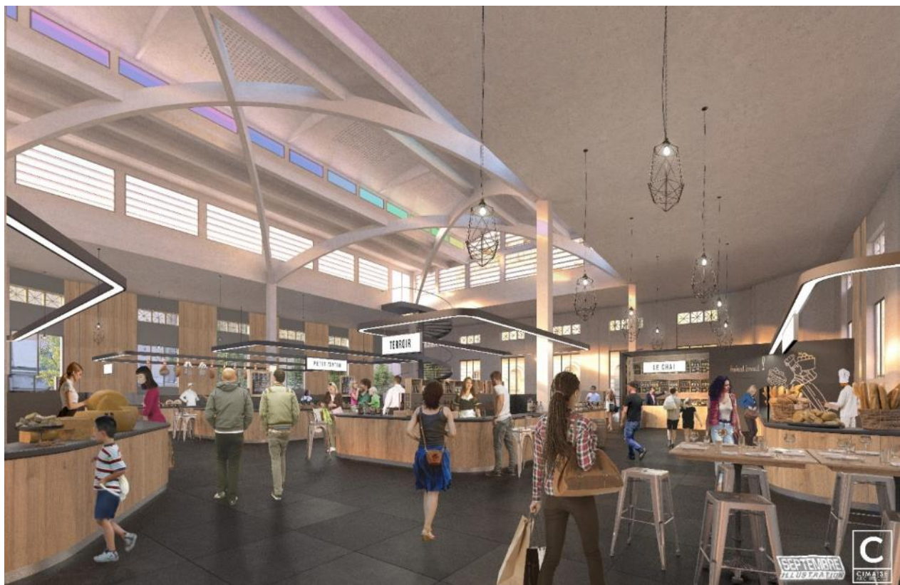
Vue de l'aménagement intérieur des halles