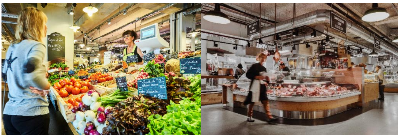
D'autres halles réalisées par Biltoki

Notre concept : " on n'a rien inventé... ce que nous proposons, ce sont des halles modernes aux valeurs authentiques ! Notre leitmotiv : la convivialité et la qualité, aussi bien dans les halles qu'au cœur de l'entreprise. Chacune est conçue de façon propre, pour respecter sa singularité : il n'y a pas de modèle duplicable chez nous ! Un projet de halle, c'est à chaque fois une nouvelle aventure ". expliquent les 4 associés.